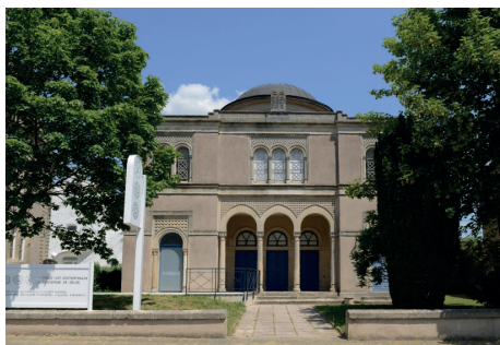
Centre d'art contemporain - la synagogue de Delme.