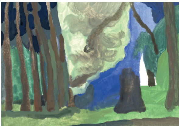
Camille Meyer, La mer d'alsace , acrylique sur papier, 2021.

Après une matinée d'exercices variés permettant de tester différents outils de dessin et de peinture (fusain, encre, feutres, gouaches...), l'après-midi sera consacré à la création d'une performance collective de dessins et d'images projetées, réalisées en direct et en lien avec un morceau de musique.