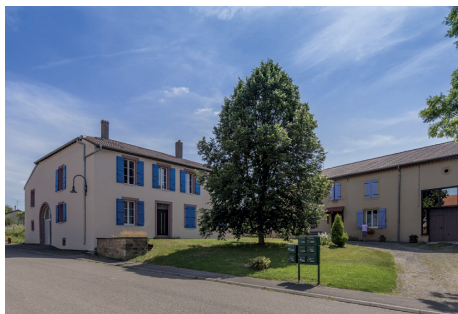
La résidence d'artistes à Lindre-Basse, 2017.

Située à l'arrière de la synagogue, la Gue(ho)st House est une architecture-sculpture réalisée par les artistes Christophe Berdaguer et Marie Péjus. Ils ont transformé une maison existante qui fût tour à tour prison, école et chambre funéraire en lieu dédié à l' action pédagogique . Elle permet d'accueillir les ateliers artistiques, les rencontres avec des artistes, des événements (lectures, concerts, projection, etc.).