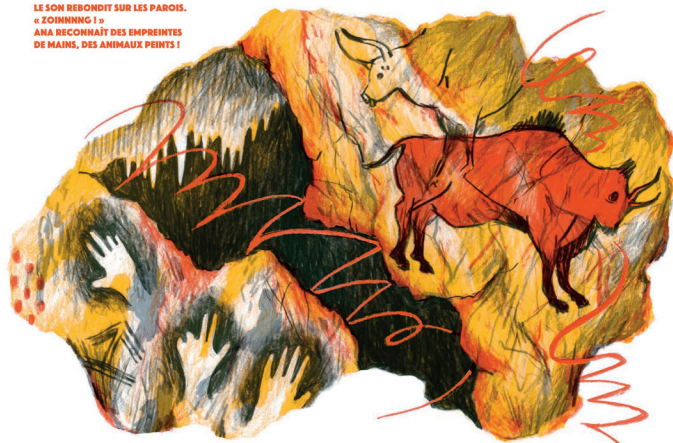
Renaud Perrin, illustration du livre Ana et l'âne A , édition Mineolux, 2023.

LE SON REBONDIT SUR LES PAROIS. « ZOHNNING ! » ANA RECONNAIT DES EMPREINTES DE MAINS, DES ANIMAUX PEINTS !