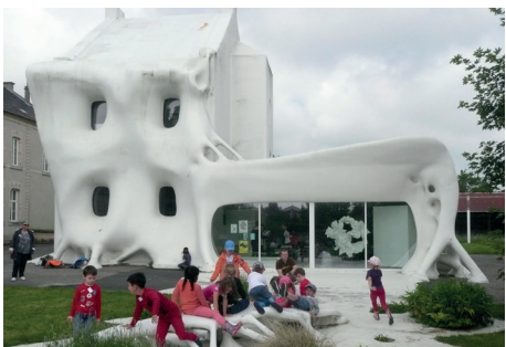
Gue(ho)st House, commande publique de Berdaguer & Péjus, 2012.

Parallèlement, la mission de soutien à la création et à la diffusion passe par une politique éditoriale. Le centre d'art co-édite des livres d'artistes, des multiples, des monographies en lien avec les expositions, manière de faire rayonner autrement le travail mené sur place.