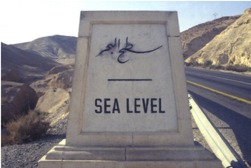
Project for the Dead Sea, 1999 - 2010