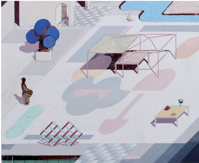
Canopy , 2012 Huile tempera sur toile 143 x 175 cm