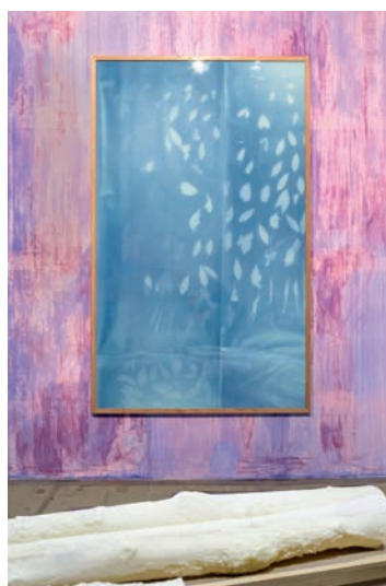
Thu-Van Tran, In the Fall, in the Rise ; Penetrable ; The Red Rubber (détail), 2017 Vues d'exposition, Moderna Museet, Stockholm, 2017