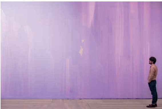
Thu-Van Tran, Penetrable , 2017 Vue d'exposition, Moderna Museet, Stockholm, 2017