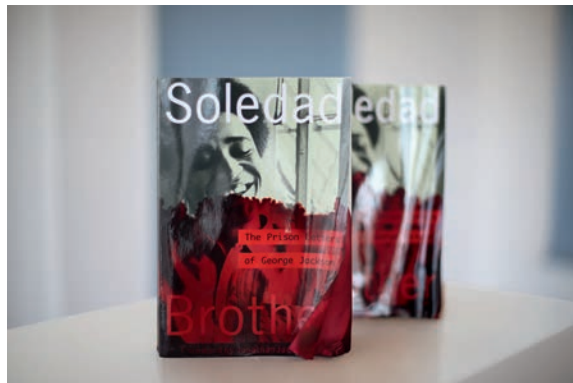
Thu-Van Tran, L'imaginaire – Jackson , 2009