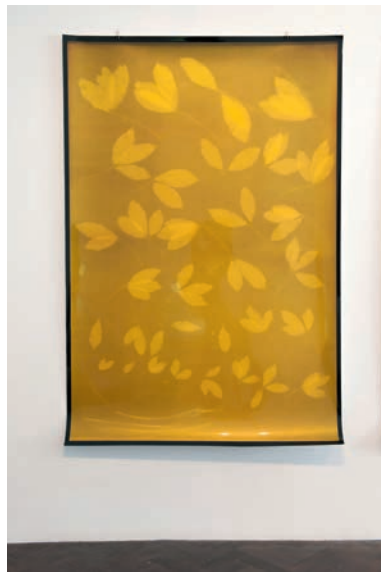
Thu-Van Tran, Au Levant Phu-Rieng , 2015