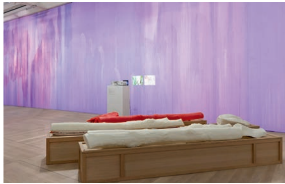
Thu-Van Tran, The Red Rubber; Penetrable , 2017 Vue d'exposition, Moderna Museet, Stockholm, 2017