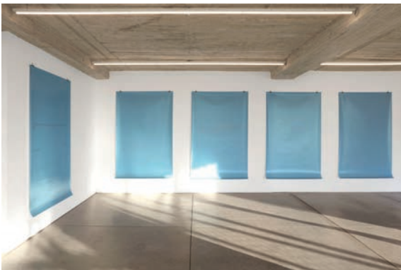
Thu-Van Tran, We live in the flicker , 2016 Vue d'exposition, Ladera Oeste, 2016