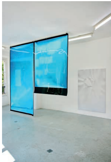
Thu-Van Tran, Air and Dreams #1 & #2 , 2017 Vue d'exposition, galerie Joseph Tang, Paris, 2017