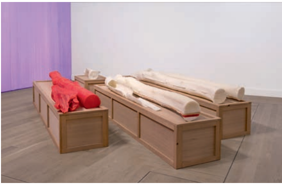
Thu-Van Tran, The Red Rubber , 2017 Vue d'exposition, Moderna Museet, Stockholm, 2017