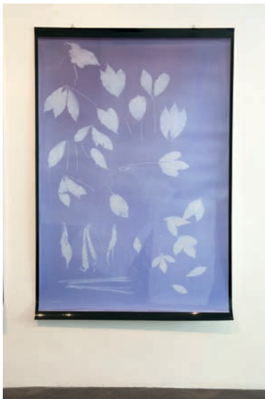
Thu-Van Tran, Au Couchant Fordlandia , 2015 Courtesy de l'artiste et Meessen De Clercq, Bruxelles