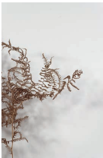
Dominique Ghesquière, Passage , 2013, fougères. Vue de l'exposition « Terre de profondeur », CIAP – Île de Vassivière, 2013.