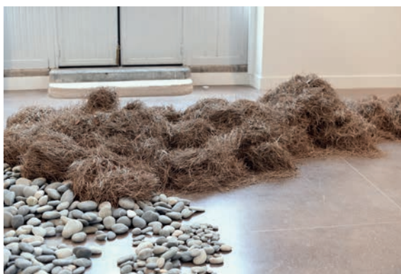
Dominique Ghesquière, Mémoire d'eau , 2016, aiguilles de pin, et Pierres roulées , 2014, galets, collection Frac Aquitaine. Vue de l'exposition « Les trois lointains », Parc culturel de Rentilly, 2016.