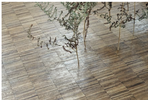
Dominique Ghesquière, Passage , 2013, fougères. Vue de l'exposition « Terre de profondeur », CIAP – Île de Vassivière, 2013.