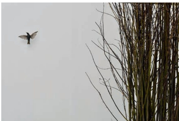
Dominique Ghesquière, Forêt , 2018, branches de noisetiers, et Oiseau , 2014, étourneau naturalisé. Vue de l'exposition « Pierres des fées », Le Point Commun, Cran-Gevrier, 2018.