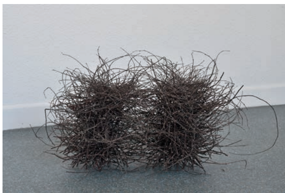
Dominique Ghesquière, Conférence des oiseaux , 2015, brindilles de bouleau. Vue de l'exposition « Pierres des fées », Le Point Commun, Cran-Gevrier, 2018.