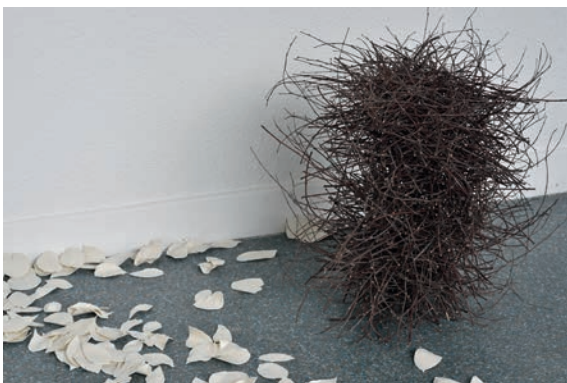
Dominique Ghesquière, Conférence des oiseaux , 2015, brindilles de bouleau et Feuilles , 2018, porcelaine. Vue de l'exposition « Pierres des fées », Le Point Commun, Cran-Gevrier, 2018.