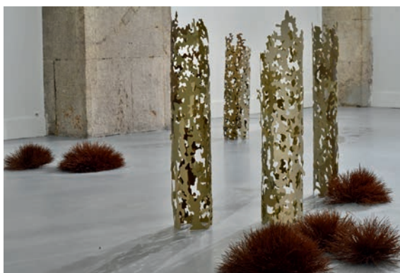
Dominique Ghesquière, Rideau d'arbres , 2016, bois de sycamore, peinture et Herbes rares , 2017, aiguilles de pin. Vue d'exposition, Galerie des Ponchettes / MAMAC, Nice, 2017.