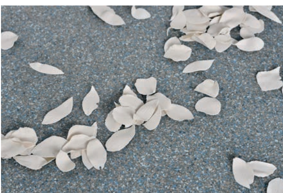
Dominique Ghesquière, Feuilles , 2018, porcelaine. Vue de l'exposition « Pierres des fées », Le Point Commun, Cran-Gevrier, 2018.