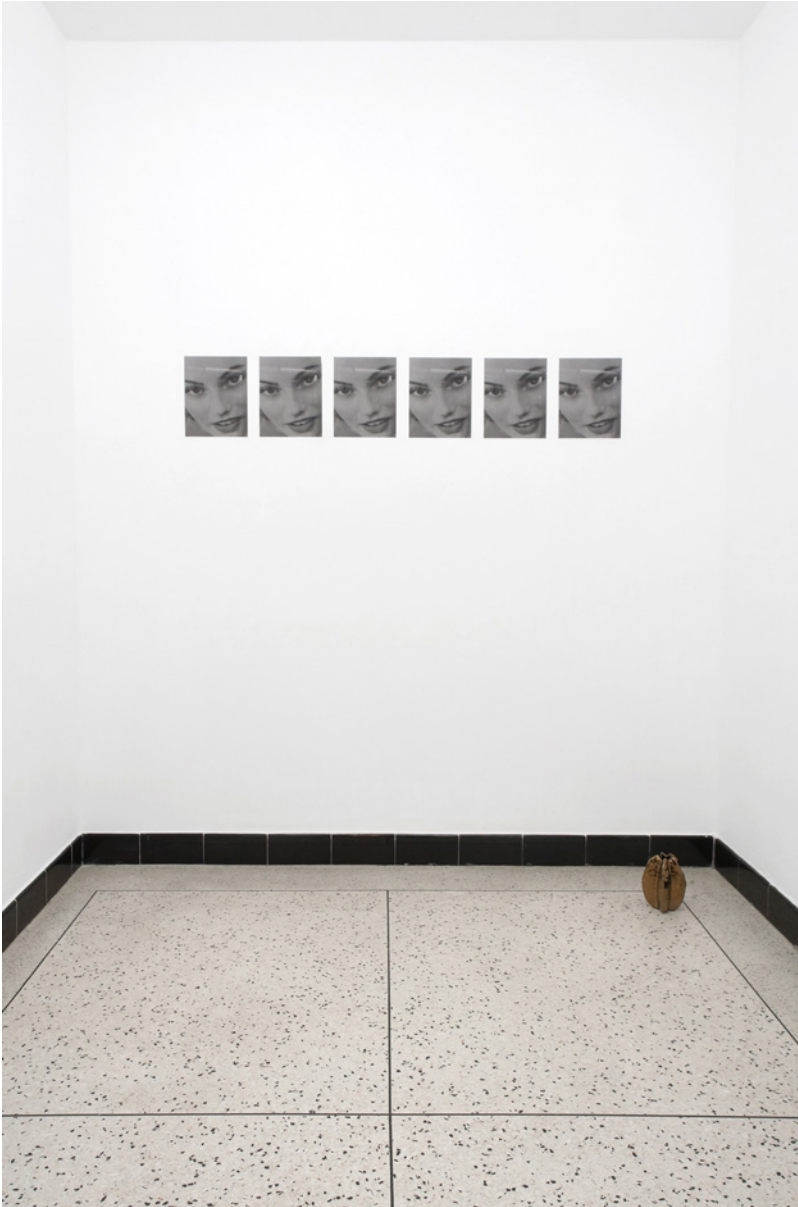
Pierre-Olivier Arnaud, élément , 2022, impression offset sur papier et objet trouvé. Vue d'exposition home alonE , Clermont-Ferrand, 2022.

Des vues de l'exposition seront disponibles après le vernissage. Ces visuels en haute-définition seront téléchargeables dans l'espace presse sur le site www.cac-synagoguedelme.org (identifiant et mot de passe sur demande).