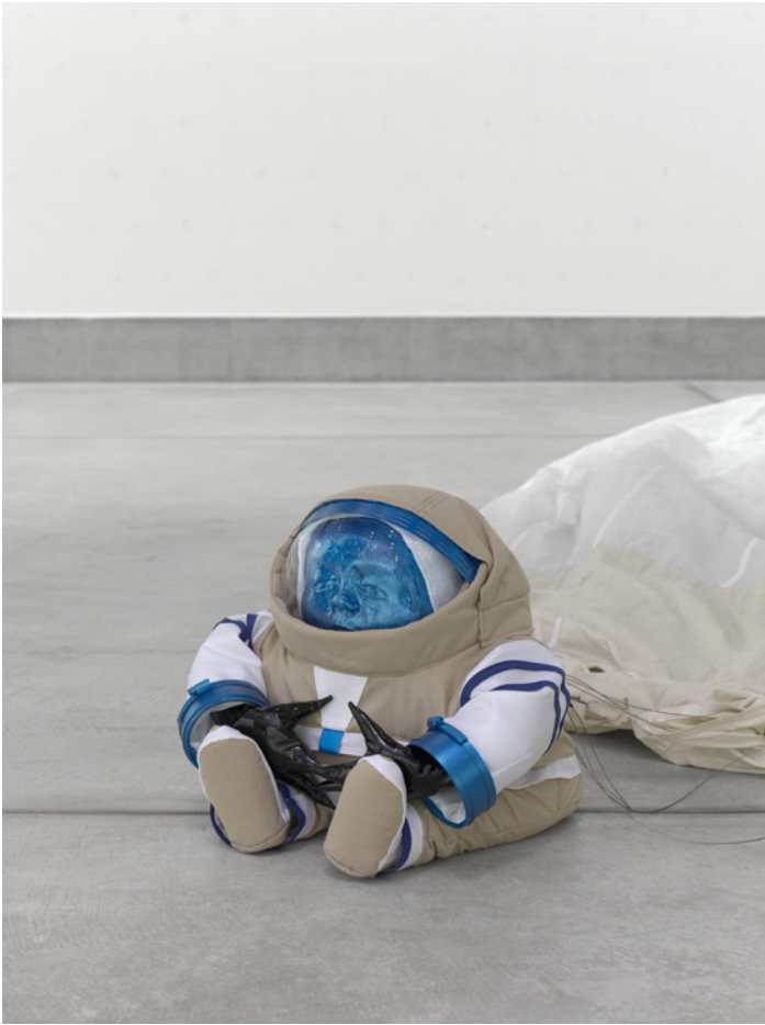
Denis Savary, MAE , 2019, tissu, métal, polystyrène, 35 x 35 x 44 cm.