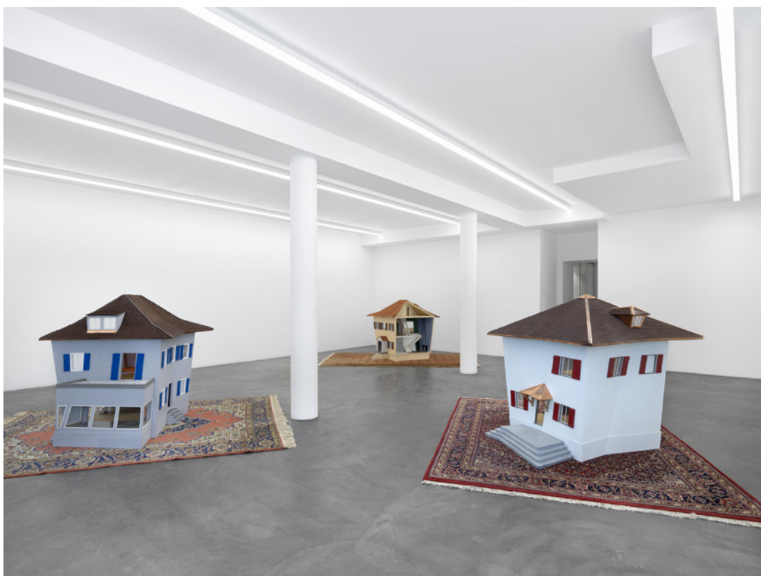
Vue de l'exposition Ithaca , Denis Savary, Galerie Maria Bernheim, 2021.