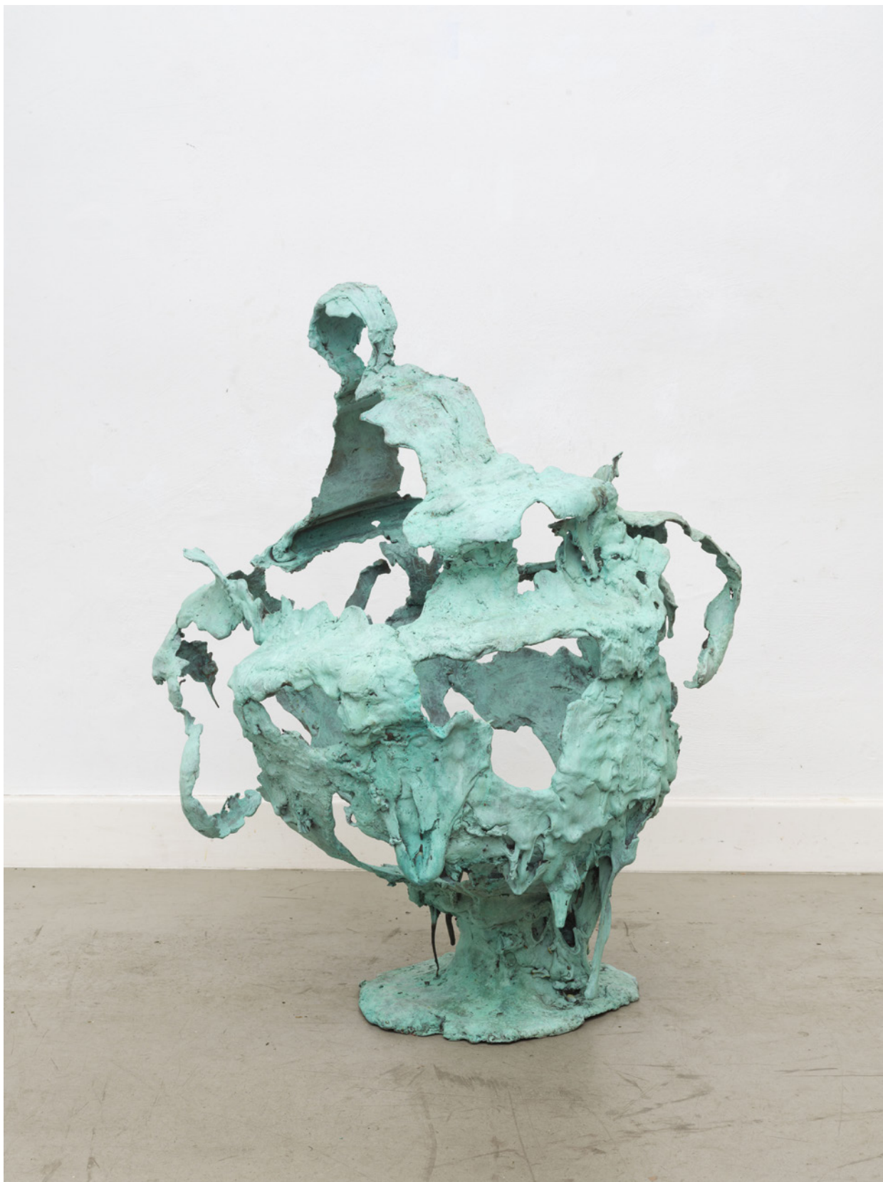
Raphaela Vogel, Pokal , 2023, Bronze vert patiné, 111 x 90,5 x 67 cm.