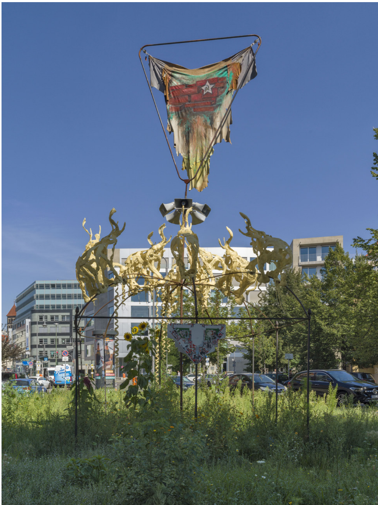
Raphaela Vogel, vue de l'installation, Elephant's Memory (Memorial Structure) , 2023, Kunstverein am Rosa-Luxemburg-Platz, Berlin.