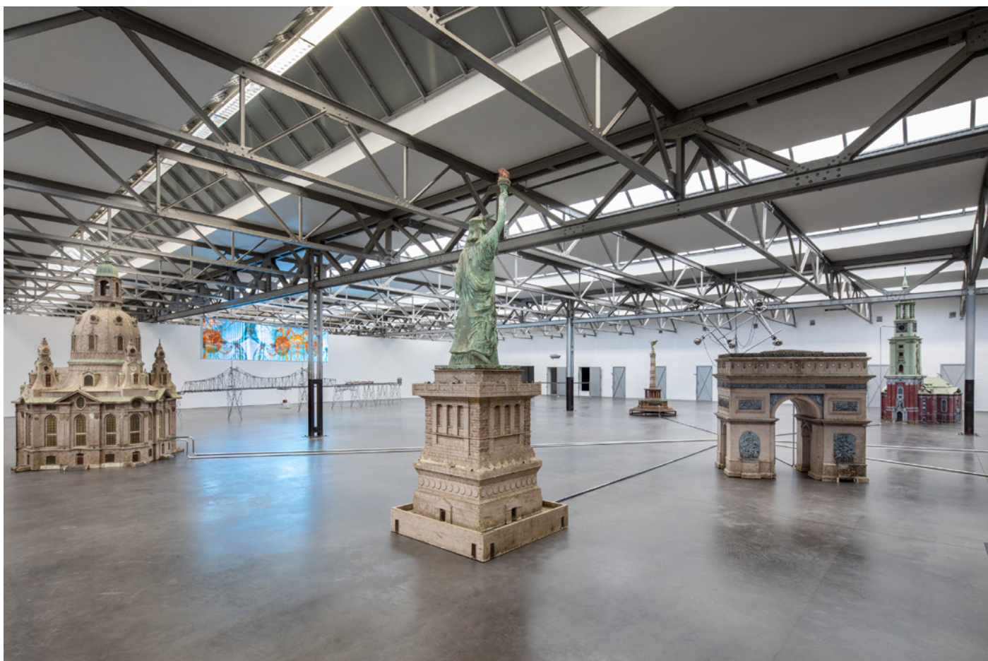
Vue de l'expositon KRAAAN , Raphaela Vogel, De Pont Museum, Tilburg (Pays-Bas) 2023. Rollo , 2019.