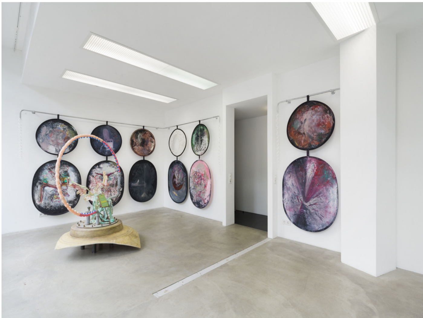
Raphaela Vogel, vue de l'installation Found Subject , 2023.

Des vues de l'exposition seront disponibles après le vernissage. Ces visuels en haute-définition seront téléchargeables dans l'espace presse sur le site www.cac-synagoguedelme.org (identifiant et mot de passe sur demande).