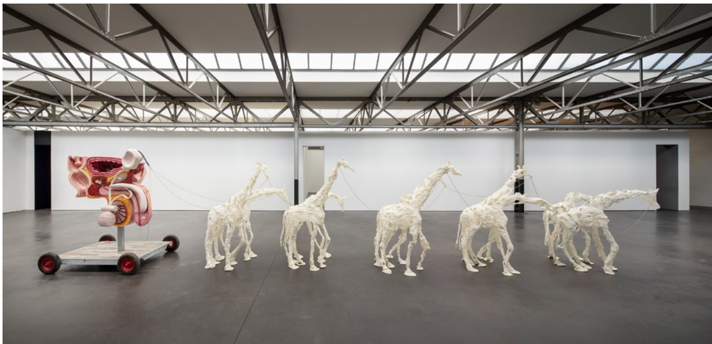
Vue de l'exposition KRAAAN , Raphaela Vogel, De Pont Museum, Tilburg (Pays-Bas) 2023. Können und Müssen , 2022. Courtesy de l'artiste, BQ Berlin, Galerie Meyer Kainer, Vienna. Photo : Eddo Hartmann