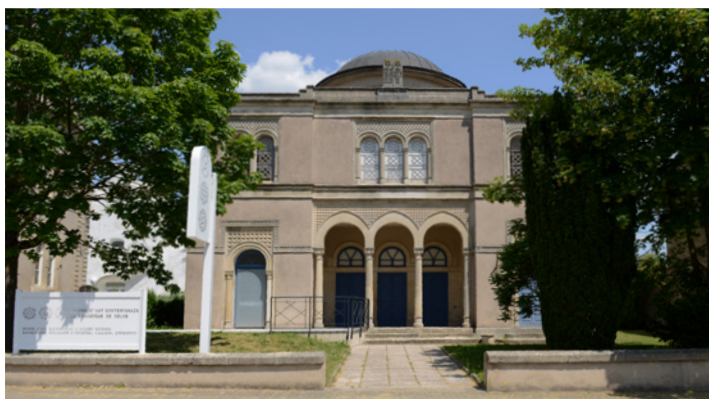
CAC - la synagogue de Delme.