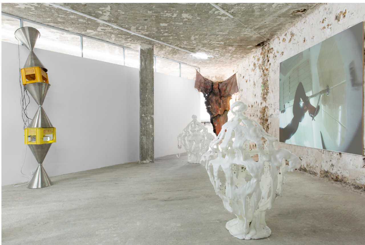
Vue d'installation, Raphaela Vogel, Paris Internationale 2023.