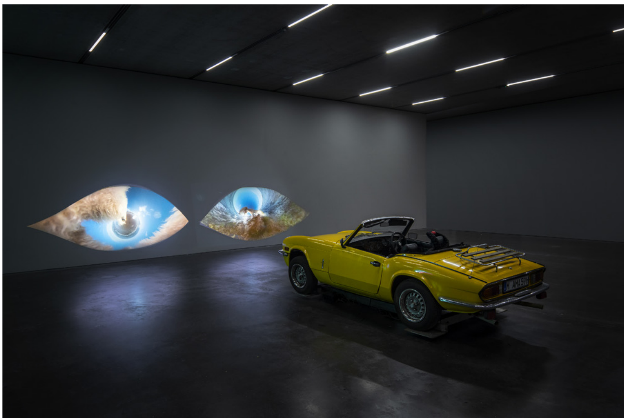
Vue de l'exposition KRAAAN , Raphaela Vogel, De Pont Museum, Tilburg (Pays-Bas) 2023. A Woman's Sports Car , 2018.