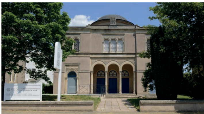
CAC - la synagogue de Delme.