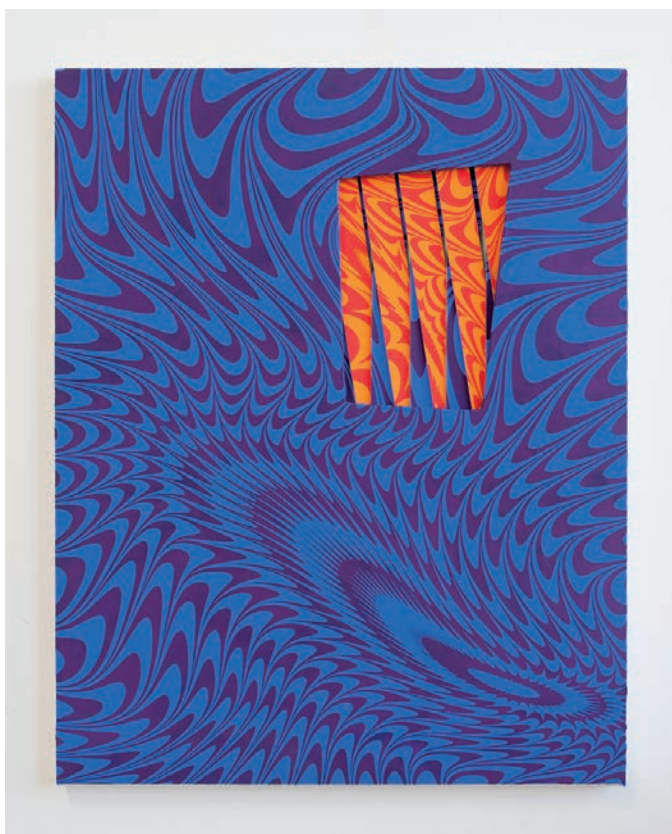
Charlotte Houette, Secret egg / blue , 2024, Flashe sur toile, avec carton, 75 x 60 cm.