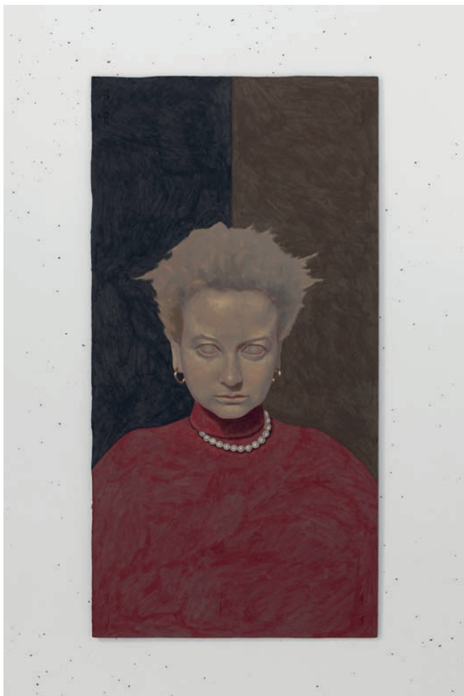
Matthieu Palud, Untitled , 2024, acrylique sur bois, 45 x 60 cm.