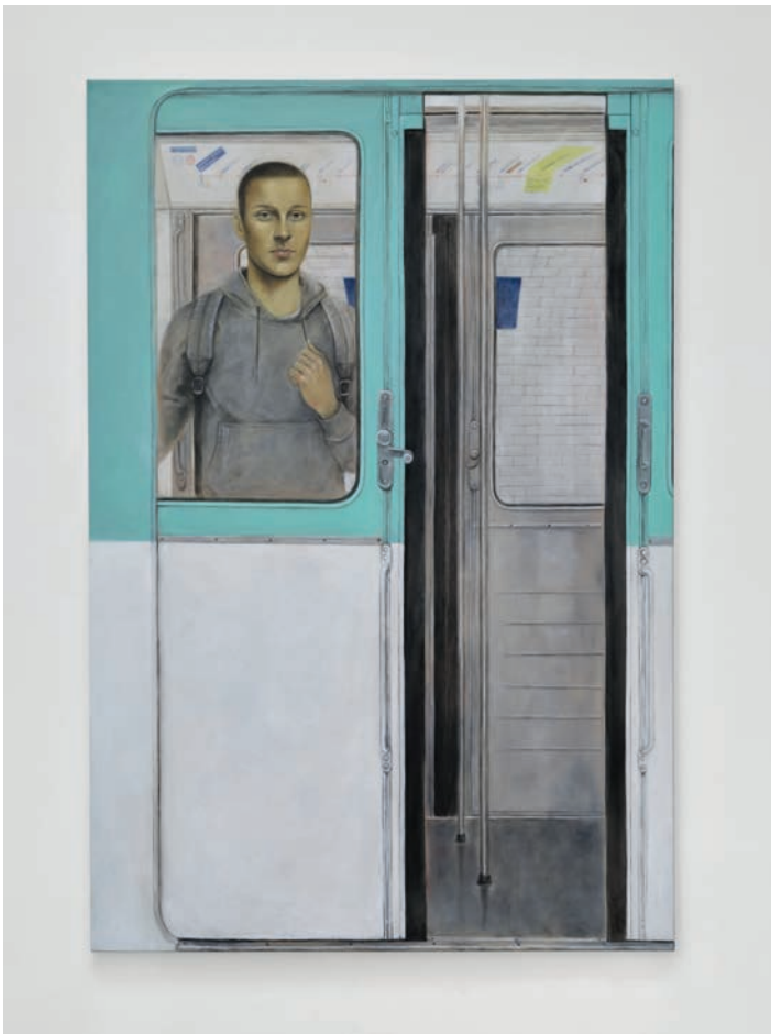
Cédric Rivrain, Métro , huile sur lin, 195 x 130 cm, 2023. Collection particulière. Courtesy de la galerie Fitzpatrick, Paris et de l'artiste.