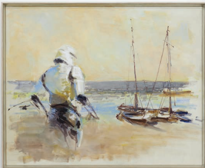
Nicolas Ceccaldi, Ship in a harbor, shallow bay , 2023, huile sur toile, châssis, 80 x 100 cm.