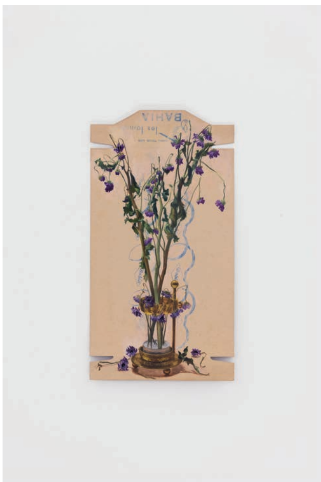
Louise Sartor, Incenso , 2024, Gouache sur carton, 46 x 24 cm. Courtesy de la galerie Crèveœur, Paris et de l'artiste. Photo: Alex Kostromin.