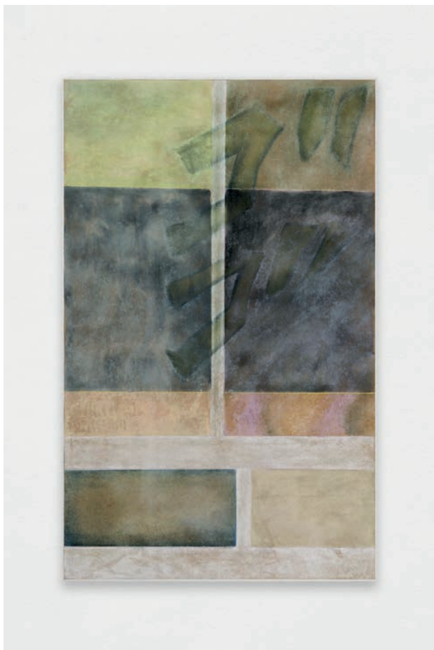
Jacent, Naruto , 2023, Pastel tendre sur bois, cadre d'artiste, 120,8 x 75,6 cm. Courtesy des artistes.