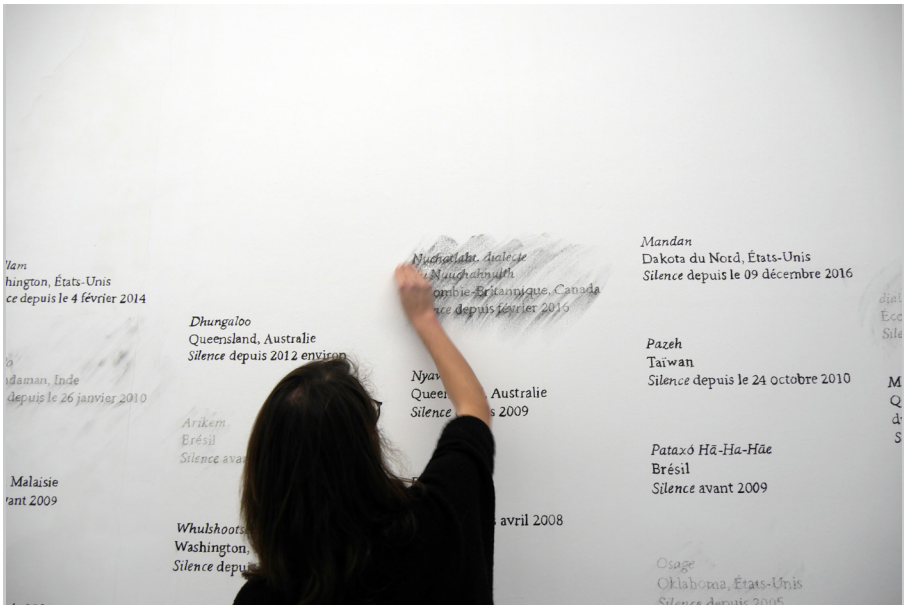
Marianne Mispelaëre Bibliothèque des silences , 2017 - en cours. Dessin mural in situ au fusain, action performative non annoncée.