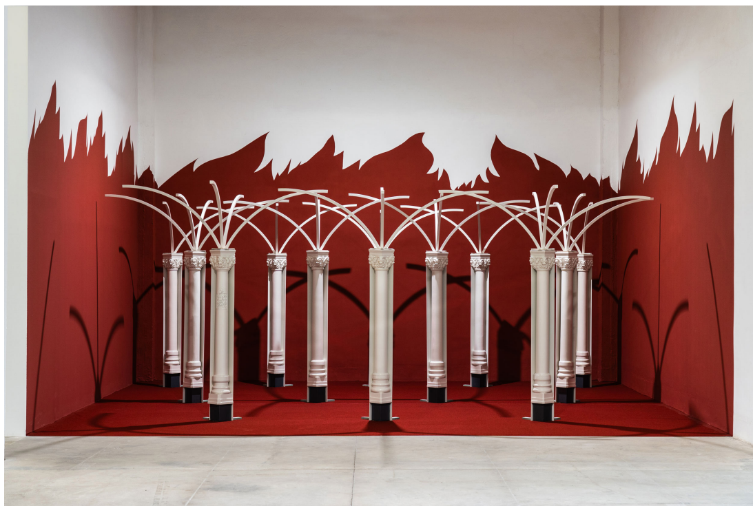
Hussein Nassereddine Years of the Shining Face, 2025 Exposition personnelle au Beirut Art Center, Liban.