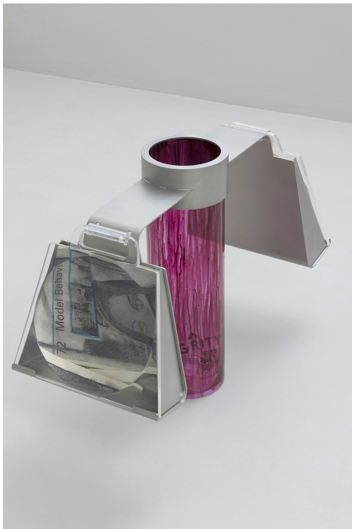
Costanza Candeloro The Secret Workshop, 2024 Céramique, impression par décalcomanie.