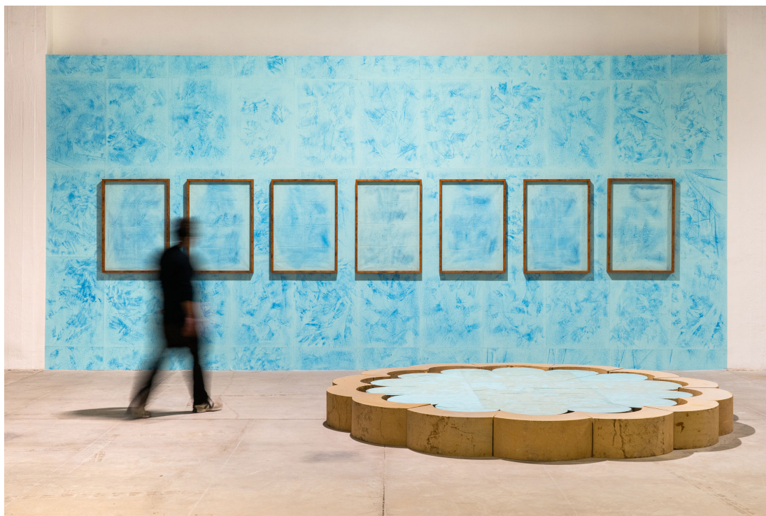
Hussein Nassereddine Years of the Shining Face, 2025 Exposition personnelle au Beirut Art Center, Liban.